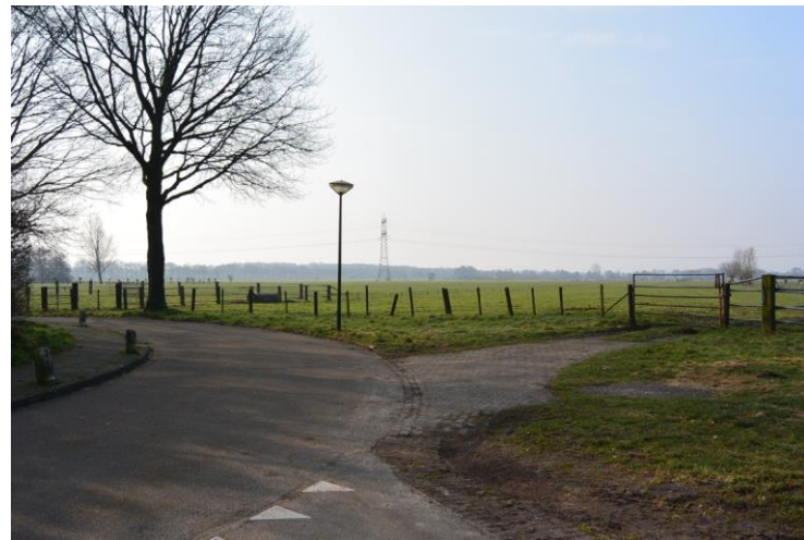
Planetenbaan, rechts begint het fietspad richting Groenekan). Komen hier 200 woningen?

aan de gemeente om hiervoor de noodzaak te onderbouwen en een locatie aan te dragen, aansluitend aan de kern", aldus de toenmalige gedeputeerde Huib van Essen (ruimtelijke ordening). Gedeputeerde Van Essen zei onlangs in een interview met het Algemeen Dagblad dat het niet nodig is om "lukraak in het groen te bouwen. Het is niet zo dat we ieder groen plekje in onze provincie moeten bebouwen."